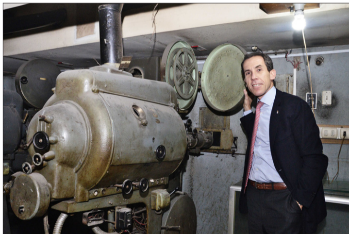
Un antiguo proyector cinematográfico.

Las añejas salas las arrendará y readequará la Corporación de Desarrollo de Santiago para instalar un jardín infantil, un gimnasio comunitario o un salón de eventos, y se integrarán al Plan Maestro, la iniciativa que busca revitalizar el centro de Santiago,