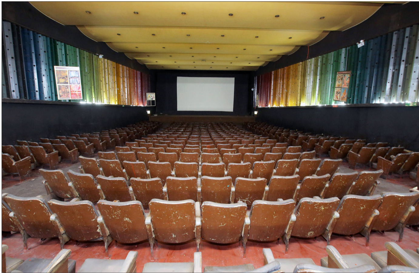
Cubiertas de polvo, en las viejas salas, aún permanece el telón para proyectar las películas.

Plan Maestro restaurará las salas Nilo y Mayo de la galería Plaza de Armas